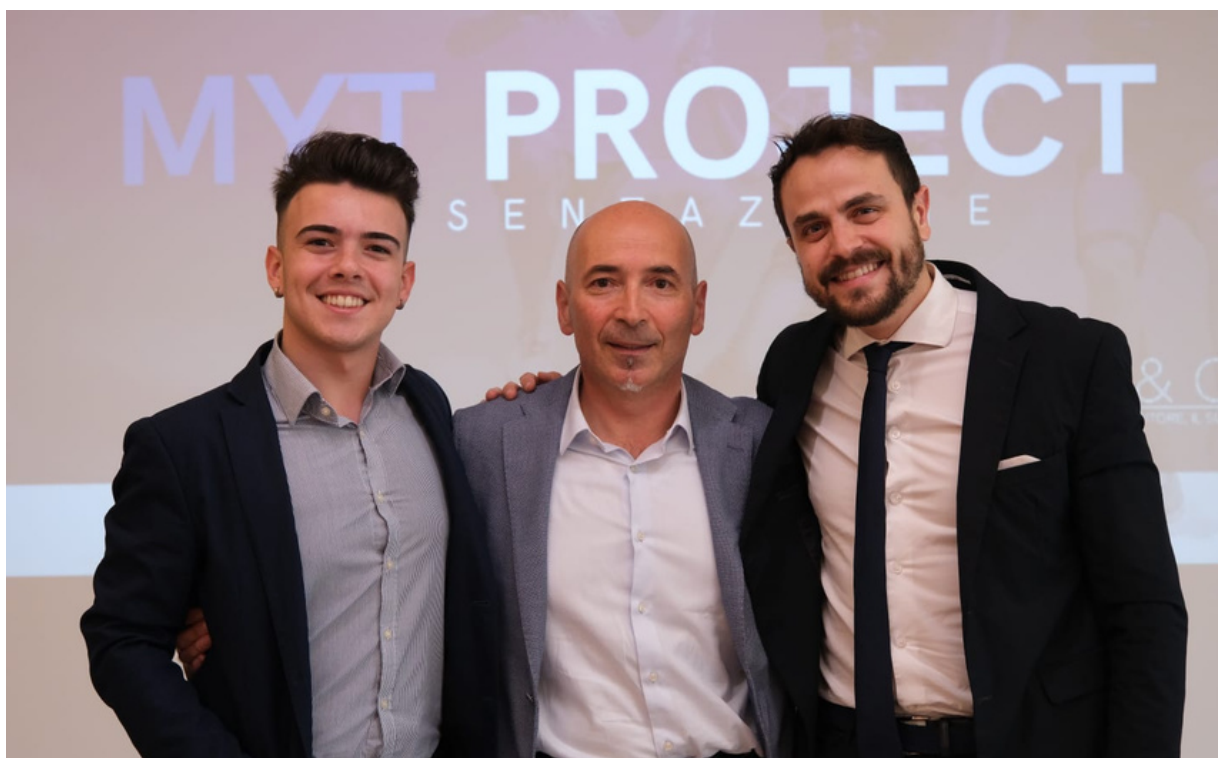
In foto: il direttore dell'Ufficio Scolastico Regionale della Sardegna incontra i direttori del progetto GenZ e del progetto Master Your Talent.